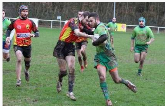
Senior à Vervins face à Douai le 4/02