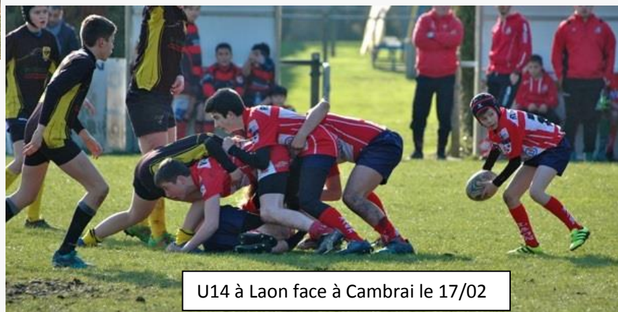
U14 à Laon face à Cambrai le 17/02