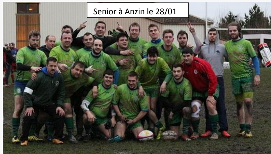
Senior à Anzin le 28/01