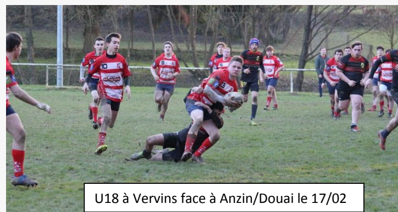
U18 à Vervins face à Anzin/Douai le 17/02