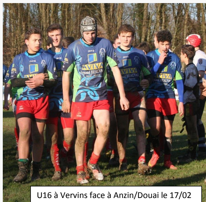
U16 à Vervins face à Anzin/Douai le 17/02