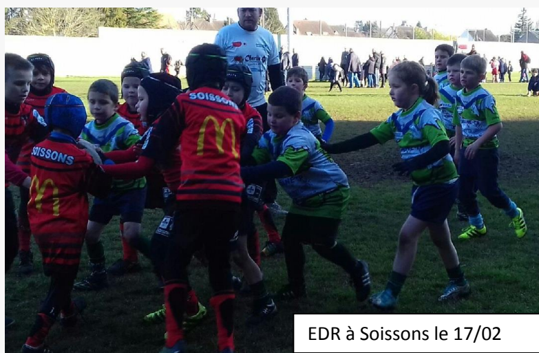
EDR à Soissons le 17/02